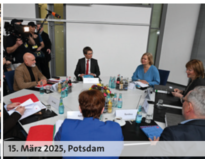
15. März 2025, Potsdam