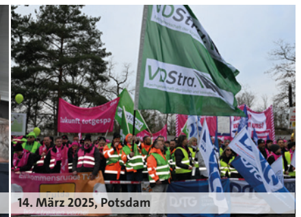
14. März 2025, Potsdam