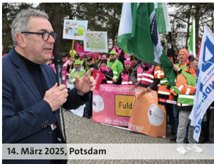
14. März 2025, Potsdam