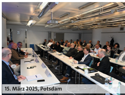
15. März 2025, Potsdam